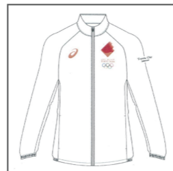
ボランティアユニフォーム